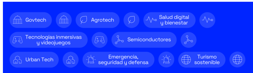
Figura 1: Áreas estratégicas para la innovación en València

Los proyectos de innovación premiados en este ámbito deberán demostrar sus resultados e impactos en una o varias de las Áreas Estratégicas para la Innovación (en adelante, AEI ) establecidas en la mirada innovadora a la ciudad de València y que se describen a continuación.