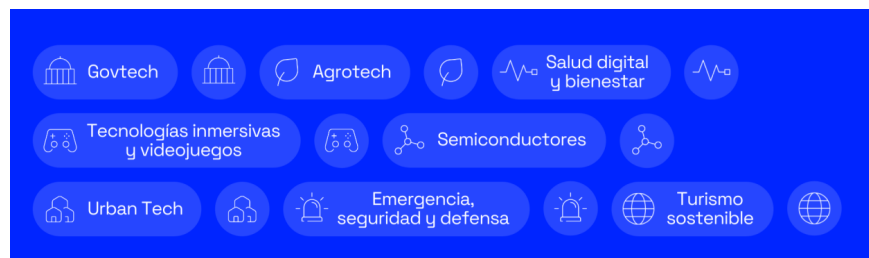
Figura 1: Áreas estratégicas para la innovación en València

Las AEI sectoriales definidas en este ámbito subvencionable se desarrollarán siempre y con carácter prioritario dentro del marco competencial municipal, orientadas a proyectos piloto, experimentación urbana y mejora de servicios públicos locales , coordinándose y complementándose con las competencias autonómicas o estatales cuando así sea necesario.